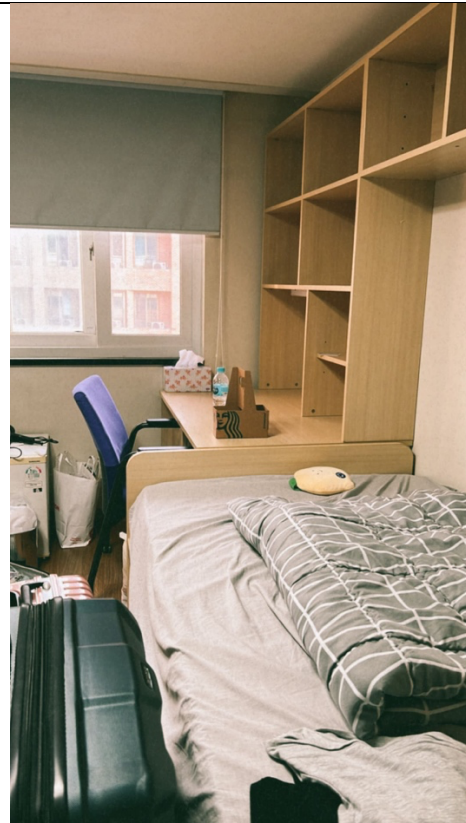
I House 宿舍