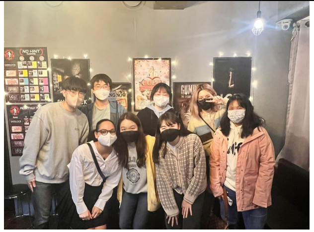
Yonsei Global Program Application 小組出遊